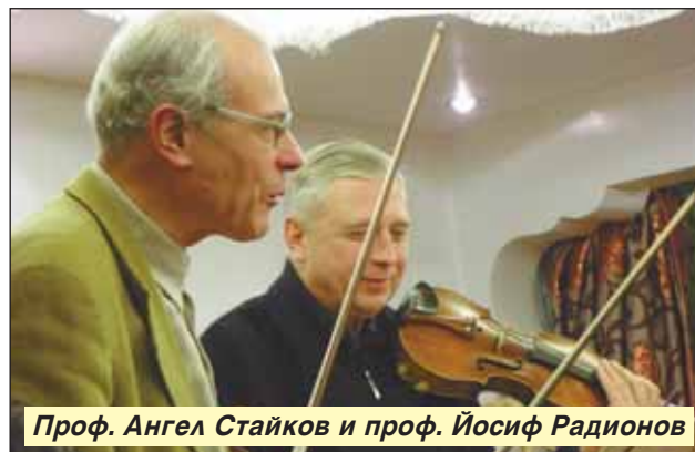
Проф. Ангел Стайков и проф. Йосиф Радионов

ше, че ще бъде абсолютният и безспорен фаворит. От първия до последния ден на гласуването с 30 000 гласа повече от всички останали никакъв българин не се съмнява-