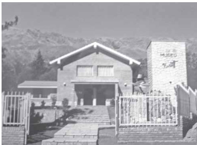
Музеят в Аржентина, където се съхраняват металопластиките на Г. Куртев

Обръщаме внимание на читателите да правят разлика между Георги Куртев (1870-1961) от Айтос и художника Георги Куртев (1916-краят на XX в.), живял в Аржентина