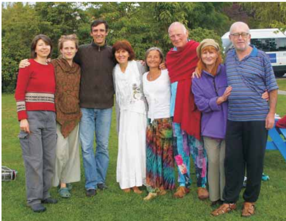
С приятели след Паневритмия