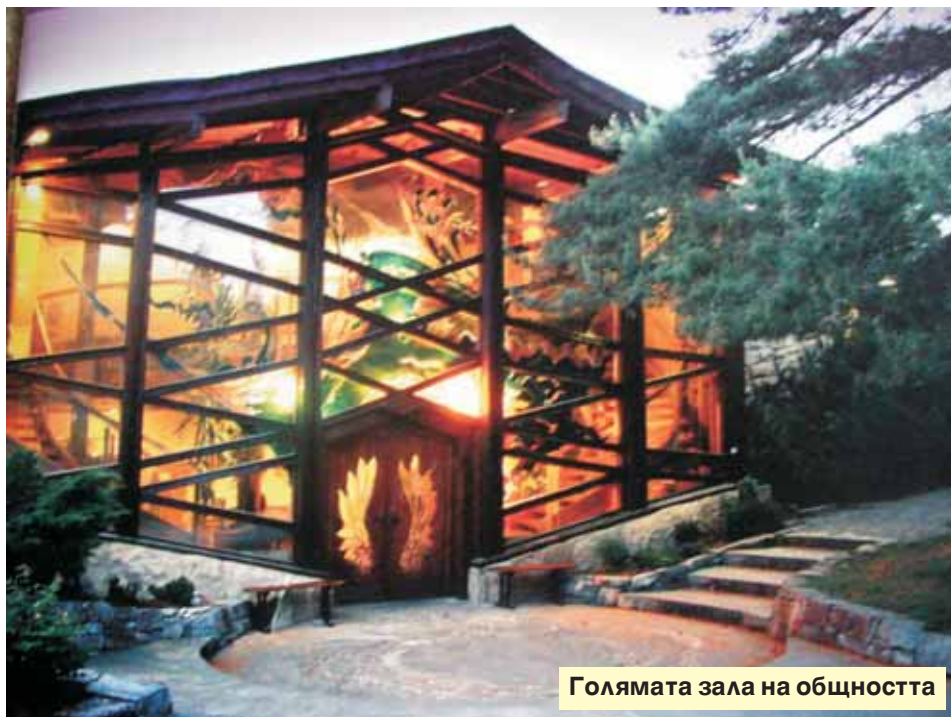
Голямата зала на общността