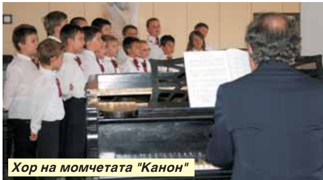
Хор на момчетата "Канон"