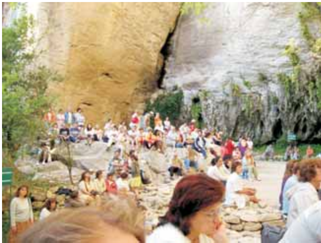
Концерт в Голямата пещера

Тази година съборът премина под знака на 100-годишнината на шуменската братска група. В съботната вечер юбилейът беше отбелязан чрез мултимедийно представяне на снимки и документи от историята на шуменската група. Историята ни учи, че нищо не започва от нас - поколения братя и сестри са работили на духовната нива, за да имаме добрите условия днес ние, техните наследници. За повечето от тях знаем само по предания и откъслечни спомени. Старите снимки ни срещат отново с тях. Внимателно се вглеждаме в техните лица и намираме себе си, своите стремежи и идеали. Техният пример е показателен - един живот, отдаден на служба на Бога и на делото на Учителя чрез безусловна преданост и постоянство. Цял един живот от младежка възраст до дълбока старост е преминал в ежедневна, постоянна и неуморна работа със Словото на