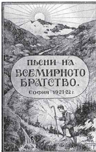
Кориците на песнарката от 1921 и 1921/1922 г.

статията Реджинал Б. Спан подробно споделя личните си впечатления от церителя Шлятер (навсякъде в статията името е изписано с а!), беден общар, емигрант от Германия, при когото през 1896 г. потърсил и намерил помощ за заболяването си в гр. Денвър, Колорадо. През същата година американските вестници били пълни с разкази за чудесата, които Шлятер правел за оздравяването на мнозина чрез ръкополагане. На въпроса на ав-