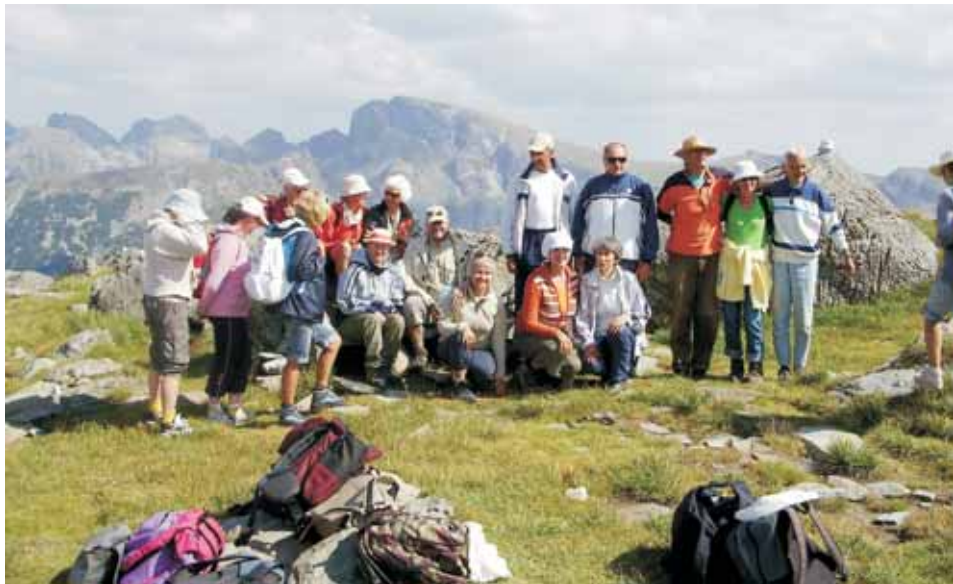
Полската група с българи на Рила

След приключването на тази среща заминахме с Ардела за Познан. Там, в Музикалната академия, направихме представяне на музиката на Учителя и на Паневритмията пред професори от Академията и пред представители на социалните служби. Това стана една сутрин след дълго и тежко пътуване през нощта и аз се чудех как ще на-