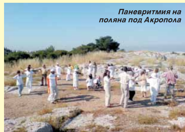
Паневритмия на поляна под Акропола

В събота вечерта се състоя концерт в частен дом в района на Плака в Атина. Присъстваха повече от тридесет човека. Вечерта премина при много приятелски и откровени разговори между представителите на двата народа. След среща-