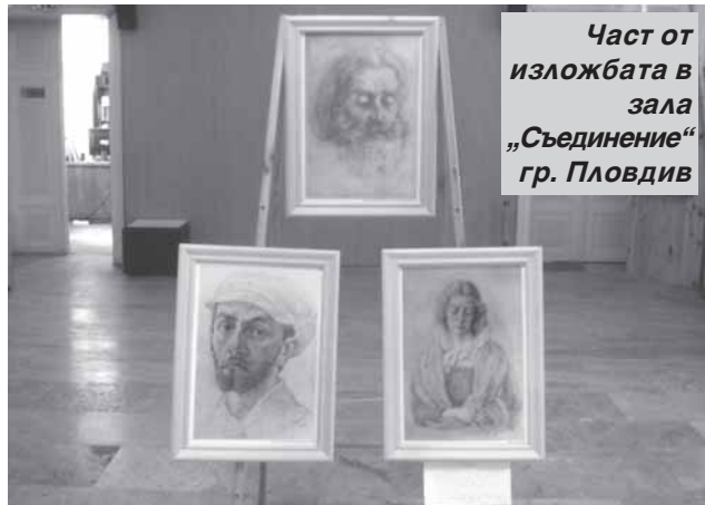
Част от изложбата в зала „Съединение“ гр. Пловдив

ра на неговото време - Учителя Петър Дънов, Айнщайн, Рабиндранат Тагор, Неру, Ромен Ролан, Николай Ръорих, Теодор Траянов, Владимир Димитров-Майстора, Махатма Ганди - та-