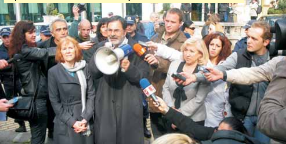
Евродепутатите пред сградата на Представителството на Европейската комисия в България