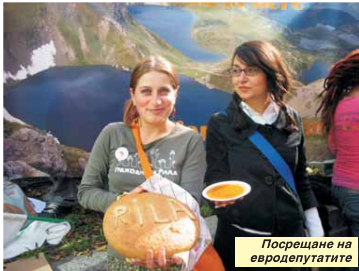
Посрещане на евродепутатите

На 30 октомври на акцията пред делегацията на Европейската комисия в България се събраха над 400 души, за да покажат подкре-