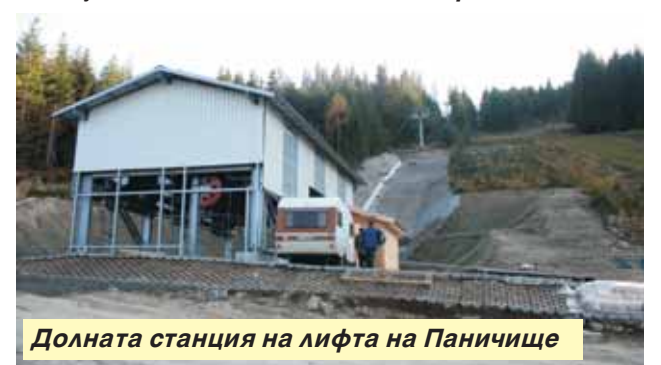
Долната станция на лифта на Паничище