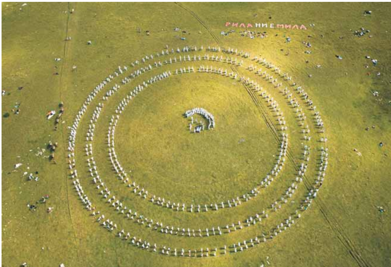
18 август 2008 г. Паневритмията на „Бъбрека“ снимана от парапланер автор: Александър Иванов

ско, разкриващи покъртителното унищожение на Пирин планина, и снимки от празничната Паневритмия на 20 ав-