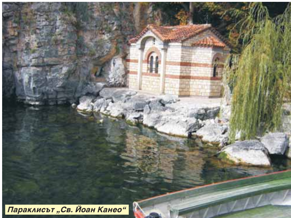
Параклисът „Св. Йоан Канео“

Охрид е град, наситен с българска история, култура и духовност. Старата част, Вароша, е разположена на хълм на самия бряг на езерото. Над нея се извисява възстановената Самуилова крепост. На фона на езерото Ох-