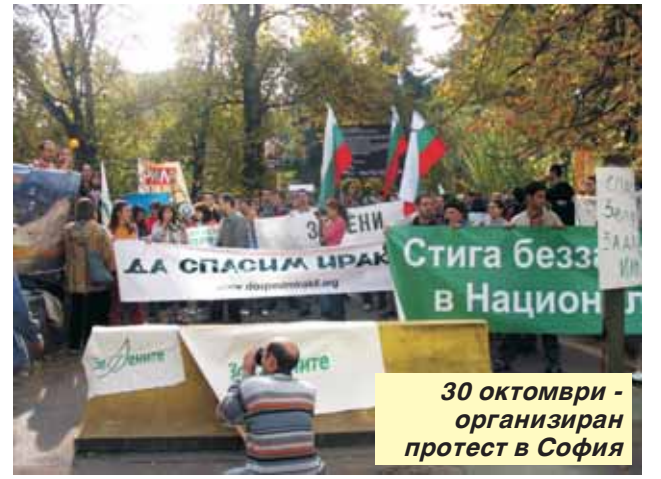
30 октомври - организиран протест в София

Пред медии и граждани Дейвид Хамерщайн беше изключително открит и разговаря с хората, събрали се пред Представителството на Европейската комисия в България: „Аз съм шокиран, аз съм много тъжен от това, което видяхме в България тези дни. Бъдете сигурни, че като се върнем в Брюксел ще представим проблемите в ЕП...“ И още: „Ситуацията в България е абсурдна - хората, протестиращи навън по улиците, са тези, които искат да са вът-