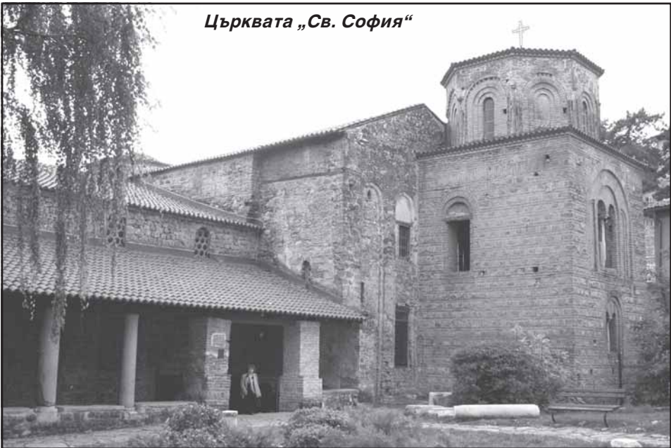
Църквата „Св. София“

рид през XIX в. Заедно с Кузман Шапкарев, Янаки Стрезов и други учители е от будителите на българската култура и духовност в града и околността.