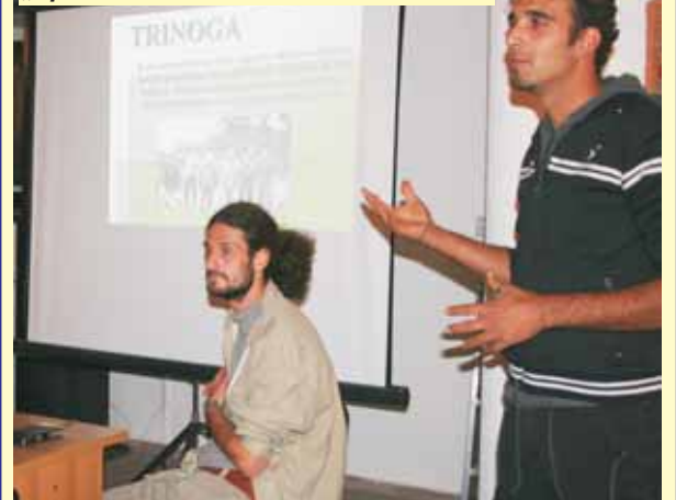
Представяне на опита на сдружение „Тринога“ за екоземеделие

Повече информация за събитието ще можете да прочетете в следващия брой на вестник „Братски живот“