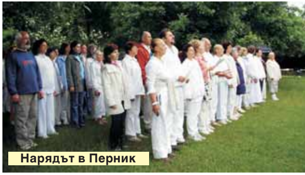
Нарядът в Перник