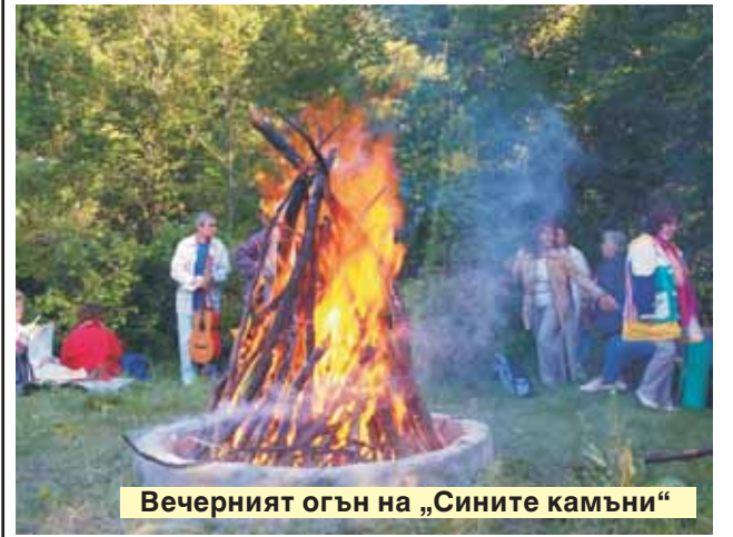
Вечерният огън на „Сините камъни“